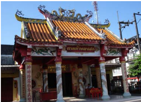
ศาลเจ้าพ่อหลักเมืองบ่อไร่-ชุมชน เป็น โฉว กง เหมี่ชว