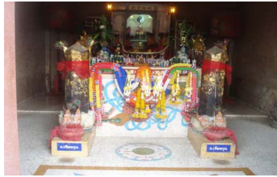
ศาลหลักเมืองขลุง-เจียง หวง กู่ เหมี่ยว หลักเมืองขลุงสองหลักภายในศาล