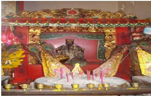
ประติมากรรมจีน ด้านซ้ายเขียนภาษาจีนว่า ซื่อ เฟย กู่ ซง หมิน เจียน -คนฉลาดสามารถแบ่งได้ว่าอะไรดีไม่ดี ด้านขวาเขียนว่า ซ่าง ผา โห่ยว เจี้ยน จือ ซื่อ -แยกแยะให้หรือทำโทษ