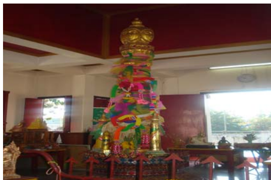
ยอดเสาหลักเมืองสลักเป็นพรหมสี่หน้า