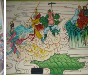
ไซอี่เรื่องราวการเดินทางของพระดังซำจั้ง

สถาปัตยกรรมไทยจัตุรมุขหลังคาทรงปราสาท ภายในมีหลักเมืองสองเสาประดิษฐานอยู่บริเวณเดียวกันมีศาลเจ้าพ่อหลักเมืองสถาปัตยกรรมจีนและประติมากรรมเจ้าพ่อหลักเมืองแบบจีนเจ้าพ่อเชื่อมกับองค์รัชและเลขาประดิษฐานไว้ จิตรกรรมภายในศาลเจ้าอธิบายเรื่องราวสมัยราชวงศ์โจวหรือเสียด๊ก เรื่องนางไซซีหญิงงามสมัยเสียด๊กเล่าจื้อศาสดาเต๋า และเรื่องเกี่ยวกับสามก๊ก นอกจากนี้ยังมีเรื่องเกี่ยวกับไซอี่หรือพระดังซำจั้ง มีอักษรจีนอธิบายประกอบด้วย