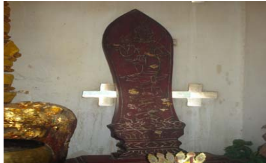
เจ้า "ไม่สลักภาษาจีน" ผิง อัน" หมายถึงปลอดภัย