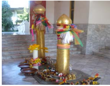
หลักเมืองเก่าและหลักเมืองใหม่จำนวนสองหลัก