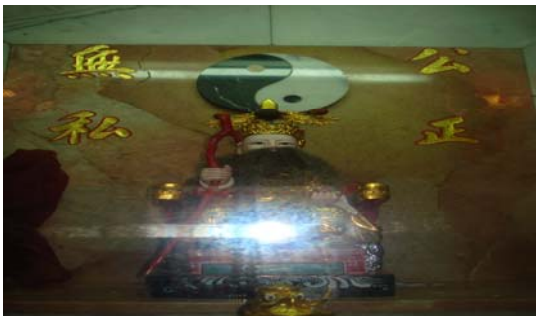
กง เจียง หว ซื่อ - คนซื่อสัตย์ - เข้าพ่อหลักเมืองขลุง