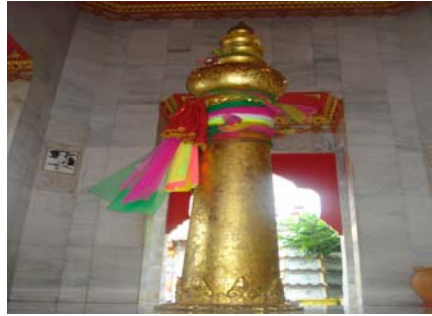
หลักเมืองระยอง