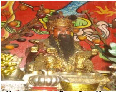
เจ้าพ่อหลักเมืองปึงเถ่ากง