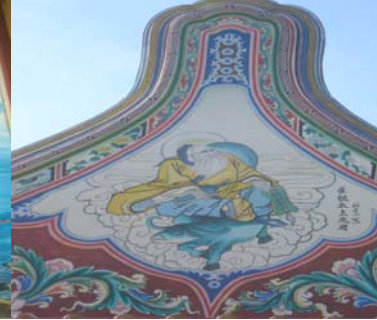
ลัทธิเต๋า(500 ปีก่อน ค.ศ.)