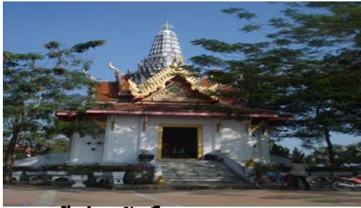
ศาลเจ้าพ่อหลักเมืองนครนายกศาลา จตุรมุขหลังคาสวนบนเป็นยอดปราสาท