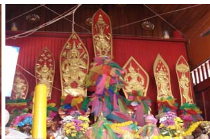
เจว็ดปิตทอง 7 แผ่น แผ่นกลางเป็น ศิลปะสมัยอยุธยาที่ศาลหลักเมืองชลบุรี

ชุมชนบางพระจังหวัดชลบุรีมีปรากฏตั้งแต่สมัยอยุธยาจากบันทึกหลักฐาน แน่นอนในแผนที่ไตรภูมิโบราณปรากฏชื่อตำบลสำคัญของชลบุรี 4 ตำบล เรียงจากทิศ เหนือไปสู่ทิศใต้ คือ ตำบลบางทราย ตำบลบางปลาสร้อย ตำบลบางพระเรือหรือตำบล บางพระในปัจจุบัน และตำบลบางละมุงหรืออำเภอบางละมุงในปัจจุบัน ได้ยกฐานะเป็น เทศบาลตำบลเมื่อวันที่ 25 พฤษภาคม พ.ศ.2542 ศาลเจ้าพ่อหลักเมืองบางพระจังหวัด ชลบุรีในปัจจุบันเป็นศาลเจ้าพ่อหลักเมืองปึงเต้ากง มีอักษรจีนกำกับไว้