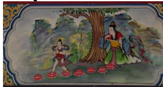
พุทธประวัติในนิกายมหายาน

จังหวัดตราดมีศาลเจ้าพ่อหลักเมืองที่บ่อไร่อีกแห่งหนึ่งเป็นสถาปัตยกรรมแบบ ไทยมีหลักเมืองภายในศาล ติดกับศาลหลักเมืองมีศาลเจ้าพ่อศาลหลักเมืองบ่อ ไร่สถาปัตยกรรมแบบจีนมีอักษรจีนกำกับไว้ว่า –เจ้าพ่อหลักเมืองบ่อไร่ –“จู้ ชาน โป่ว กง เหมี่ยว” และมีประติมากรรมเจ้าพ่อหลักเมืองบ่อไร่ประดิษฐานภายในศาลเจ้า ศาล เจ้าพ่อบ่อไร่ไม่ปรากฏหลักฐานการสร้างเมืองบ่อไร่มาก่อน