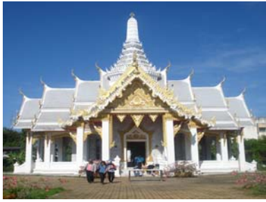
ศาลหลักเมืองศาลาจัตุรมุขสถาปัตยกรรมไทยหลังคาทรงปราสาท