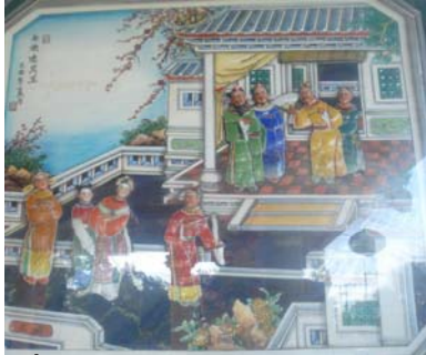
ฉี ฉือ หมิ เทวิน หวัง -ไซซีคนงามแห่งแผ่นดิน