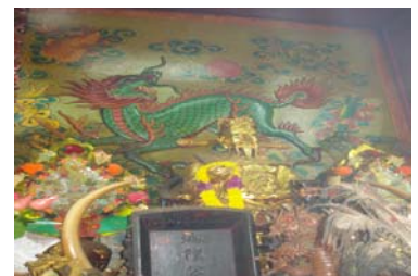
สถาปัตยกรรมไทยศาลหลักเมืองจันทบุรี หลักเมืองจันทบุรี เงิน หวง งง เสน่ เทพเงิน หวง งง เจ้าพ่อหลักเมือง