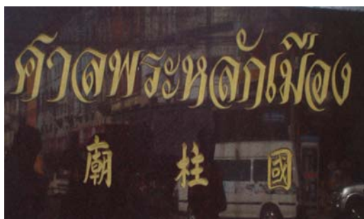
ศาลพระหลักเมือง -แก้ว ฐ เหมียว