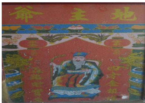
ชื่อ บึง จิง หอง จีน ชู่ ชู่ ชู่ ไฉ่ เปา ไหลด -เงินมาทั้งสี่ด้านทุกทิศ