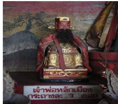
เจ้าพ่อหลักเมืองบ่อไร่