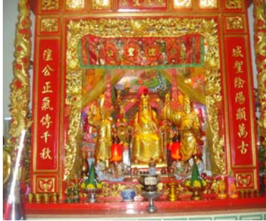
เจ้าพ่อหลักเมืองประติมากรรมจีนมีข้อความเขียนว่า ซ่าน เฮอ ไ่ว เป้า ทำศึกหรือทำตัวก็มีผลเงิน ฮี เหล่า เหลียน วาน บู๋ หอิน พยาง ขวาง กง เจิ้ง ชี ฉวน เซียน จิว ทำดีเพื่อประชาชนเพื่ออยู่ต่อไป