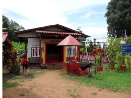
ศาลเจ้าหลักเมืองที่ค่ายเนินวงสถาปัตยกรรมไทยแบบเรียบง่าย