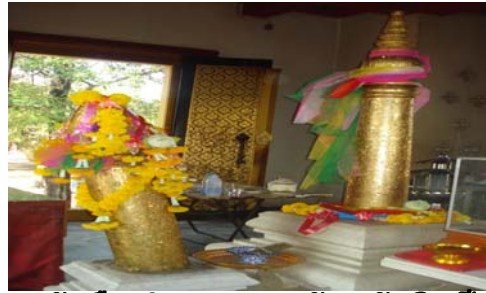
หลักเมืองจำนวนสองหลัก หลักเดิมเป็น เสารูปดอกบัวชารุด จึงสร้างหลักเมืองใหม่