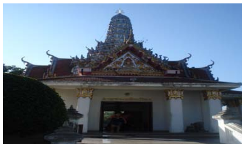
ศาลพระหลักเมืองเป็นศาลาจัตุรมุขหลังคาทรงปราสาท