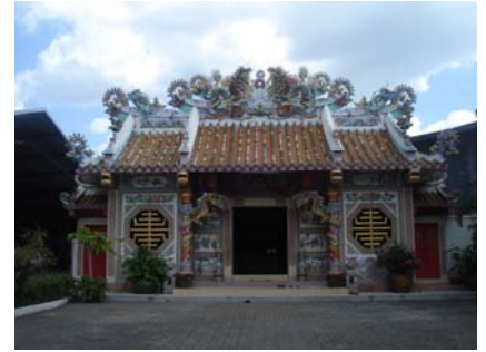
ศาลเจ้าพ่อหลักเมืองปึงเถ่ากง ระยอง