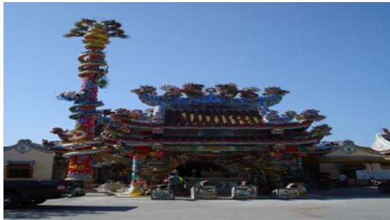
ศาลเจ้าพ่อหลักเมืองตราด