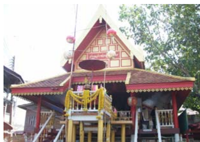
สถาปัตยกรรมไทยแบบพื้นถิ่น ภาคกลางศาลเจ้าพ่อหลักเมืองชลบุรี

ศาลเจ้า หน้าศาลมีสะพานยาวพุ่งตรงไปทะเล สะพานนี้มีชื่อว่าสะพานยาวคือยาวกว่าทุก สะพานในสมัยนั้น จึงเป็นทำขนส่งสินค้าติดต่อไปมากับต่างจังหวัดอีกด้วย ต่อมาเมื่อเรือ สะพานกลายเป็นซอยมีชื่อใหม่ว่าซอยที่ฆามาโรคซึ่งแปลว่าทางยาว เดิมศาลมีงาน ประจำปีคือประเพณีกองข้าว เข้าทรงในวันขึ้น 6 ค่ำเดือน 6 เป็นเวลาติดต่อกัน 3 วัน ตอนเช้ามีการเข้าทรงทำพิธีกองข้าวที่ข้างคลองบางปลาสร้อย ประเพณีกองข้าวก็เริ่มจาก ศาลหลักเมืองนี้เป็นแห่งแรกของจังหวัดชลบุรี ศาลนี้บูรณะครั้งที่ 1 พ.ศ.2492 3