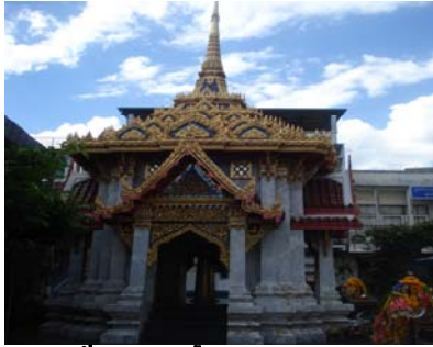
ศาลเจ้าพ่อหลักเมืองระยองหลังคามณฑป

สักทอง พระบาทสมเด็จพระเจ้าอยู่หัวรัชกาลปัจจุบันได้ทรงพระสุหร่ายและพระราชทานกลับมาสวมหลักเมืองเก่าให้สูงและสง่างามยิ่งขึ้นเป็นมิ่งขวัญสำแก่ชาวระยองตลอดไป 10