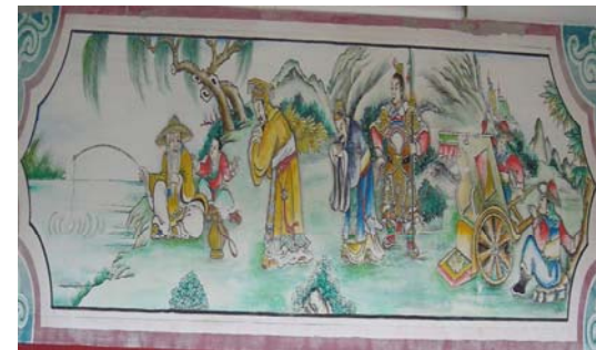
เสียดก๊ก 67 ปีก่อนพุทธศตวรรษ โจวเหวินหวัง ฉิว เสียด -โจ เหวิน หวังขอร้องให้เสียดซื้อหยางมาช่วยรบ