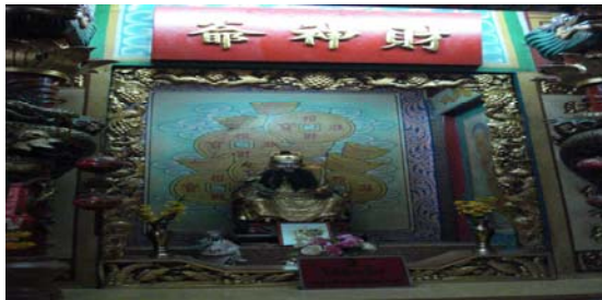
เสี่ย อึ้ง กง เจ้าพ่อหลักเมืองตราด