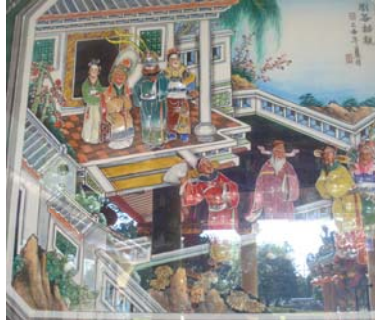
หลิว เปย เจ้า ฉิง -เล่าปี่หากภรรยา (พุทธศตวรรษที่ 1 หรือ ค.ศ.506 ยุคเสียด๊ก) ( สามก๊ก พ.ศ.763-823)