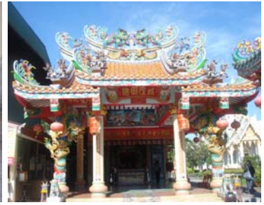
ศาลเจ้าพ่อหลักเมืองสถาปัตยกรรมจีน