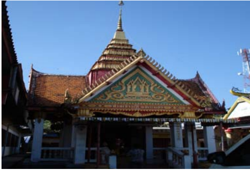
ศาลหลักเมืองบ่อไร่