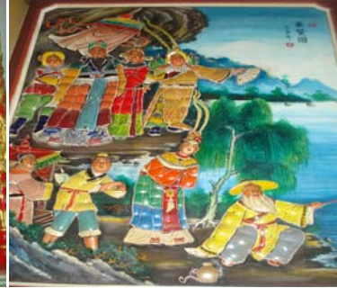
ฉิว เซียน ฉู-หาคมนทำงานในวัง ช่งเค้ เต้า ชู ไซ่ ซ่ง เหล่า จิน- เต้าเจี้ยวราชวงศ์โจวขอร้องให้เจียงจื่อหยางมาช่วยรบ (1123 -256 ปีก่อนค.ศ.)