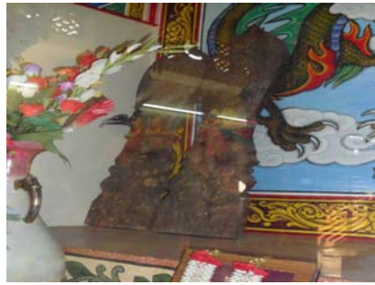
เจว็ดไม้ด้านซ้ายและด้านขวาภายในศาลเจ้าพ่อหลักเมืองจำนวน 4 แผ่นตั้งอยู่