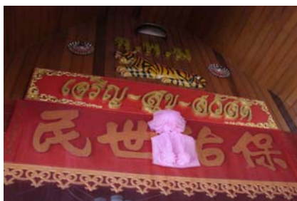
เป่า โย่ว ชื่อ หมิน -ขอ ปกป้องคุ้มครองประชาชน