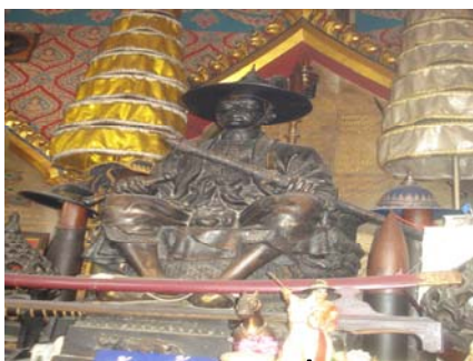
สมเด็จพระเจ้าตากสินมหาราชที่ศาลสมเด็จพระเจ้าตากสินมหาราบริเวณศาลหลักเมืองจันทบุรี