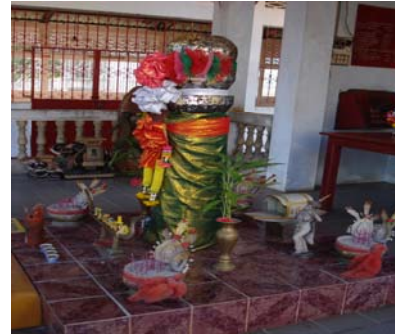
หลักเมืองบ่อไร่